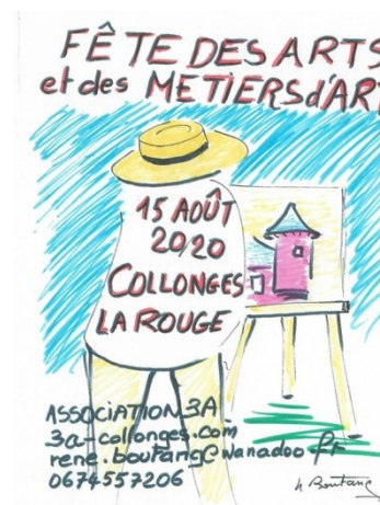
La couverture 2020 du catalogue 3A

Le coût de l'édition est compris dans celui de l'adhésion ( 30€ ) ce qui permettra à chaque adhérent, exposant ou pas, d'être destinataire du catalogue. Sa diffusion en sera élargie (une touche de langue anglaise apparaîtra).